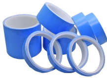
Thermal Conductive Adhesive Tape Use For Electronic Chips